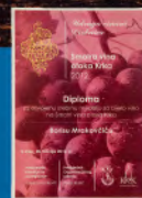
Smotra vina otoka Krka Krk, Hrvatska