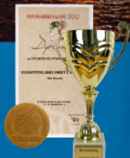
Međunarodni Sajam Turizma Novi Sad, Srbija