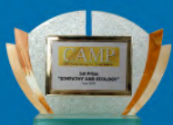
Simpaty and Ecology Italija