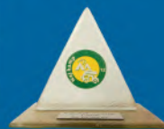
Naj kamp 2012. Slovenija